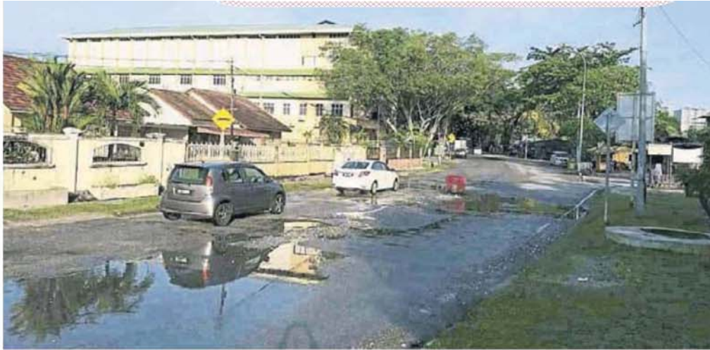
■文良港热水湖新村热水湖路发生路面溢水已1周。