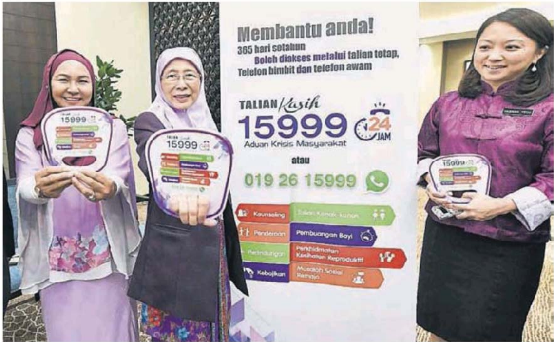
■旺阿兹莎为（中）爱心热线WhatsApp联络号码主持推介礼；左起为祖乃达和杨巧双。