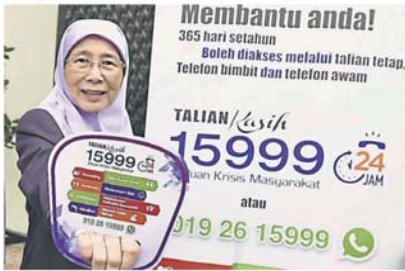
旺阿兹莎推介爱心热线 WhatsApp 联络号码。

Provided for client's internal research purposes only. May not be further copied, distributed, sold or published in any form without the prior consent of the copyright owner.