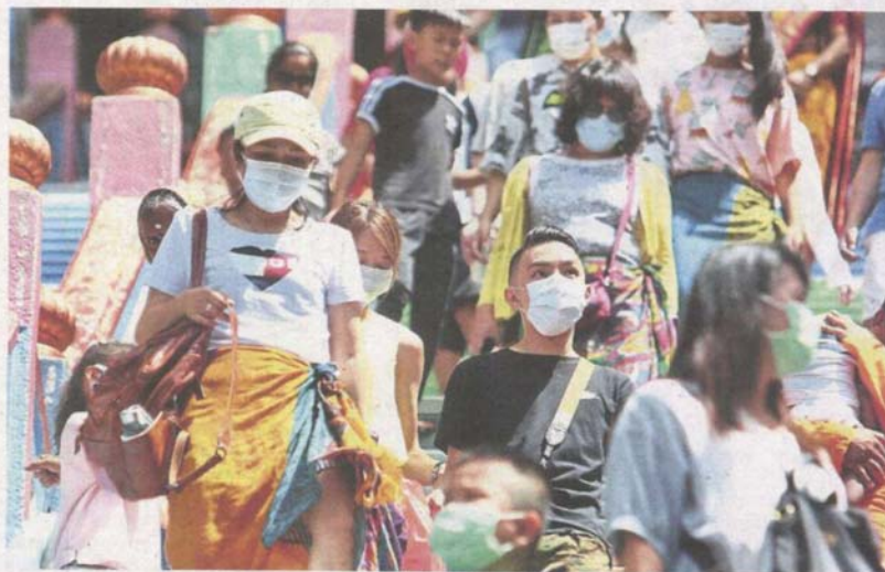
Keeping safe: Tourists wearing face masks while visiting Batu Caves.

there will be more than a million people at Batu Caves from all around the world, in a crowded area.