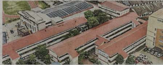
■重建的2座校舍全新屋顶,让人耳目一新。